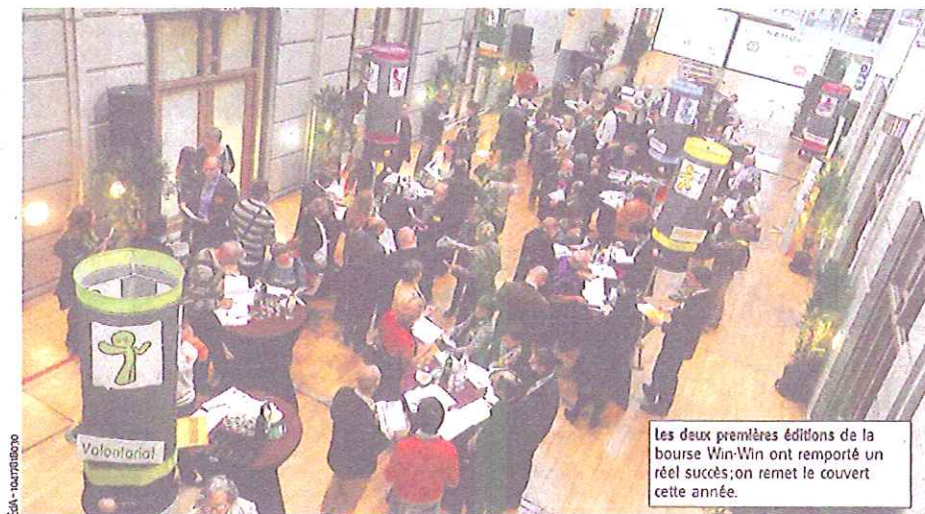
Les deux premières éditions de la bourse Win-Win ont remporté un réel succès; on remet le couvert cette année.

Mais que peut-on échanger? Tout... ou presque. Une entreprise locale pourra aider une association en lui offrant des compétences spécifiques, en mettant à disposition des lo-